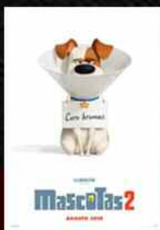
MASCOTAS 2 09-08-2019