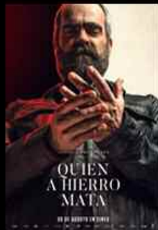
QUIEN A HIERRO MATA 30-08-2019