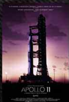
APOLO 11 16-07-2019