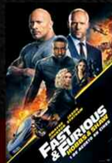
FAST & FURIOUS 02-08-2019