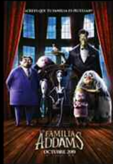
LA FAMILIA ADDAMS 25-10-2019