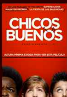
CHICOS BUENOS 23-08-2019