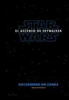
STAR WARS 20-12-2019