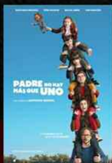
PADRE NO HAY MÁS QUE UNO 26-07-2019