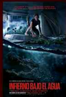
INFIERNO BAJO EL AGUA 23-08-2019