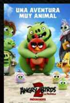
ANGRY BIRDS 2 23-08-2019