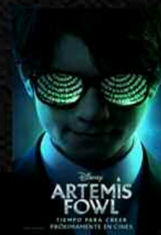
ARTEMIS FOWL 23-08-2019