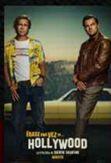
ERASE UNA VEZ EN HOLLYWOOD 15-08-2019