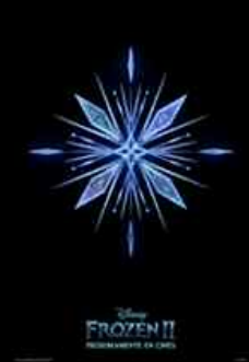
FROZEN 2 22-11-2019